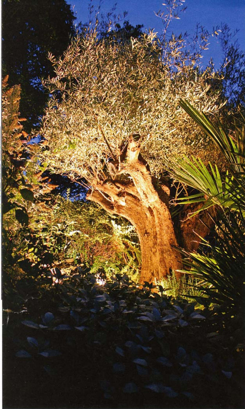
Gezielt eingesetztes Licht betont Strukturen – hier das feine Blattwerk und die knorrige Rinde des Olivenbaums