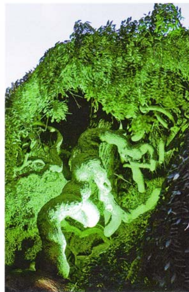
Licht verwandelt den Olivenbaum nachts in eine bizarre Skulptur