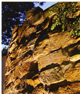
Die groben Strukturen der Bruchsteinwand sind im Tageslicht weniger deutlich